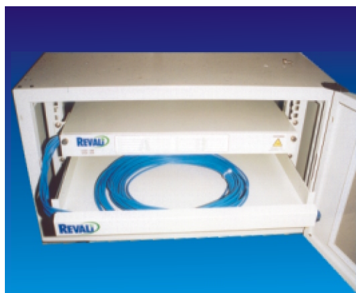
SAC-1300 INSTALADO EM UM GTO/M